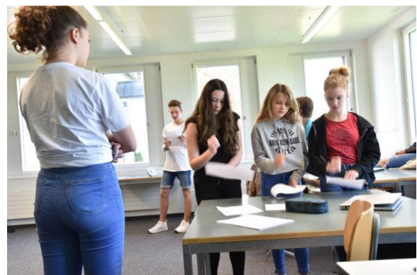
Erstes erfolgreiche Ausprobieren der selbstgeschriebenen Szenen